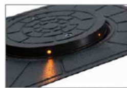
Reflektierende Folie H: 50 mm und Stahlzylinder der Farbe Grau RAL 7022 mit LED-Leuchtkranz hoher Lichtausbeute.