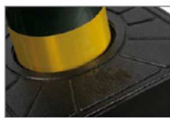
Reflektierende Folie H: 50 mm an Stahlzylinder der Farbe Grau RAL 7022

Wirtschaftlichkeit und Qualität! Das sind die Schwerpunkte der neuen Poller EASY. Eine sorgfältige Marktanalyse und eingehende Studie der Montage- und Fertigungstechnik haben zur Realisierung eines einfachen und genau auf die Kundenbedürfnisse ausgelegten Pollers geführt, der dennoch die typischen Qualitätsansprüche der Produkte erfüllt. Und Dies zu einem äußerst günstigen Preis. EASY ist in zwei Modellen verfügbar: das erste Modell EASY Ø 115-500 weist einen 500 mm hohen Zylinder mit Durchmesser Ø 115 mm auf, hat keinen Leuchtkranz und ist mit reflektierender Folie ausgestattet. Das zweite Modell EASY Ø 200-700 weist einen 700mm mm hohen Zylinder mit Durchmesser Ø 200 mm auf, ist mit Leuchtkranz und reflektierender Folie ausgestattet.