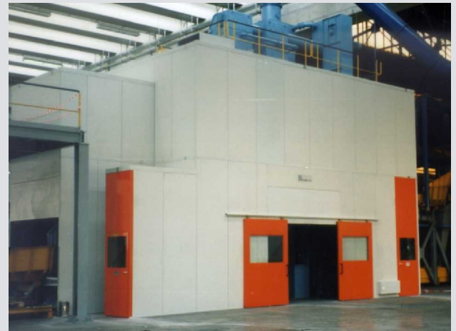
Maschinenkapselung mit Schallschutz-Türen und Fenster