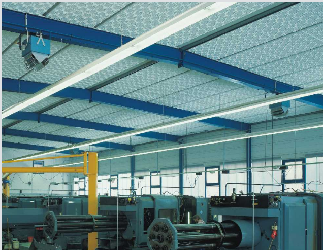
Hallenbedämpfung mit Waffelplatten

Ihr kompetenter Problemlöser im Schallschutz