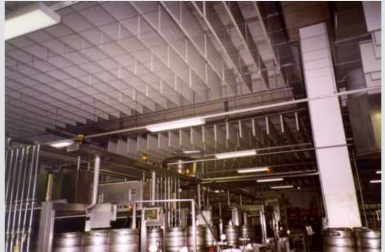
Hallenbedämpfung mit Feuchtraumabsorbieren