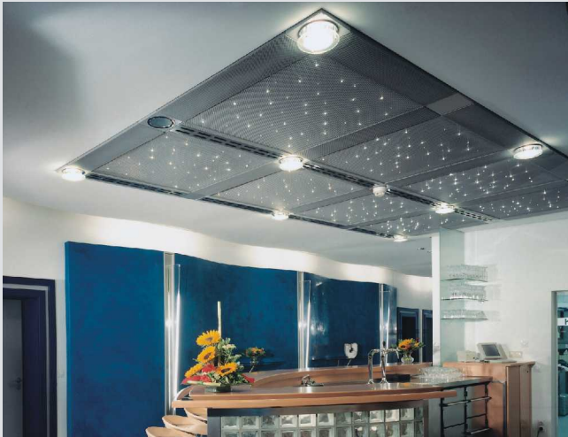
Schalldämpfung in Büro und Besprechungsräumen