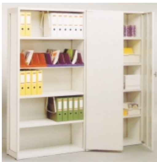
Flügeltüren aus Stahl, abschließbar.