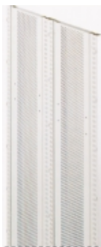
geschlossener Rahmen Stahl gelocht 6 mm