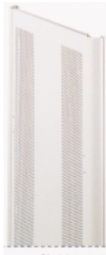
Stahl gelocht 6 mm