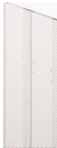
geschlossener Rahmen ungelocht