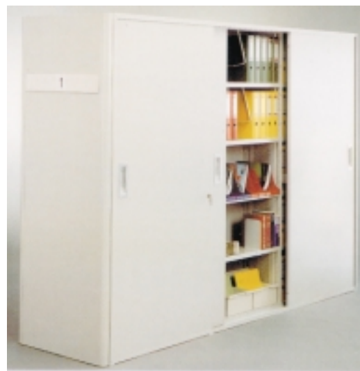
Schiebetüren aus Stahlblech; abschließbar. Die Führung der Schiebetür erfolgt in einem Profil mit Laufrollen.

Die 2000-L Regalsysteme bieten in Verbindung mit dem praxisorientierten Zubehörprogramm vielseitige Ablage- und Archivierungsmöglichkeiten.