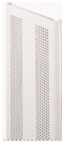
Stahl gelocht 12 mm